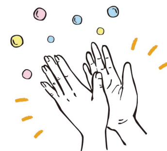
04 手をパンパンとたたいて 「パフリング」で香り広がる!