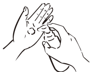
01 ミルキーを適量、手のひらへ

ミルキーの魅力をひきだす、とっておきの使い方。それは手のひらで剤をなじませた後、髪につける前にパンパンと両手をたたいて香りを広げる「パフリング」です。パフリングとともに想いをこめたら、苦手だった“かわいい”もきっと自分のものにできるはず。