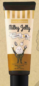
ウェーブジュカーラ ミルキーゼリー 内容量：100g ¥2,970 (税込)