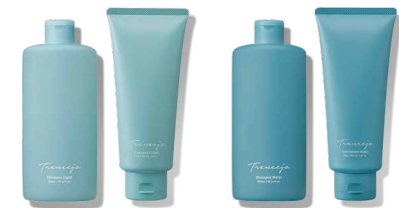
シャンプー トリートメント