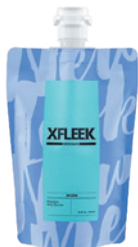
シャンプー ニフティマリン

豊富な泡できしみのない、すっきりとした洗い心地 各 250mL/¥1,980 1000mL (詰替) /¥5,280