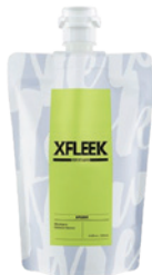
シャンプー カーミストサボン