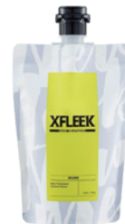
ヘアトリートメント カーミストサボン