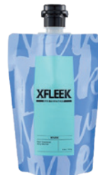
ヘアトリートメント ニフティマリン

ダメージを補修し、スタイリングがしやすい髪へ 各 250g/¥2,420 1000g (詰替) /¥6,380