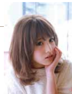
※ 写真はすべてイメージです。

※ 1 剤は「アソート アリア」、「アソート アリア エトレ」、2 剤は「アソート アリア OX-6.0」「アソート アリア OX-5.0AC」「アソート アリア OX-2.4」を使用しています。(1・2 剤の混合比は 1 : 1) ※ 毛束写真はあくまでもイメージであり、実際の色と多少異なる場合があります。 ※ 「アソート アリア」、「アソート アリア エトレ」は染毛剤 (医薬部外品) です。 ※ 本品を使用する前には、必ず使用上の注意をよく読んで、正しくお使いください。ご使用前には、毎回必ず皮膚アレルギー試験 (パッチテスト) をしてください。