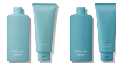
シャンプー トリートメント